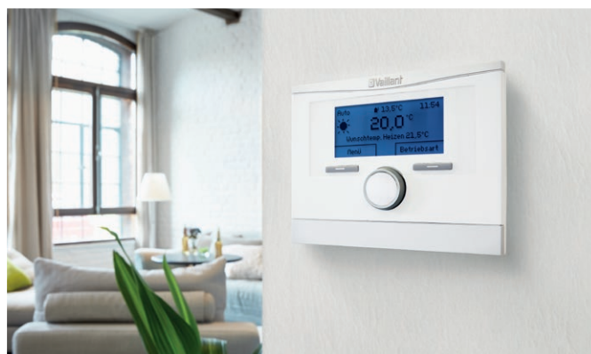
multiMATIC 700 időjárás-követő rendszerszabályozó